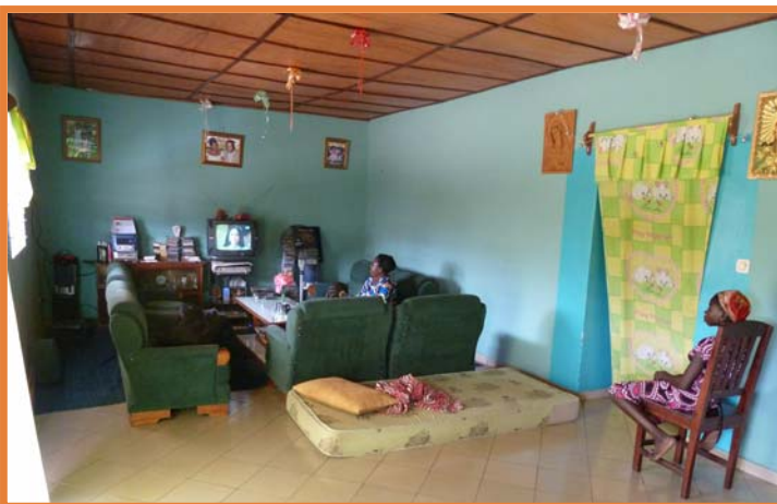
Städtischer Haushalt mit "Hausmädchen" (rechts im Bild) in Parakou (Nordbenin).

hier für mehr oder weniger lange Zeit zu leben. Kinder und Jugendliche wollen oder sollen in der Stadt zur Schule gehen oder eine Ausbildung machen. Vor allem Mädchen werden nicht selten zu städtischen Verwandten geschickt, um bei der Betreuung von kleinen Kindern und im Haushalt zu helfen.