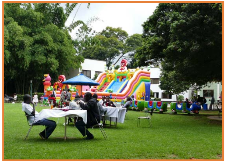
Familien beim Sonntagsausflug in Kenia

Der Begriff „ Familie “ geht vom Vorstellungsmodell der europäischen bürgerlichen Familie aus: ein Ehepaar , das mit seinen Kindern zusammen lebt. Die Bedeutung dieses sozialen Arrangements als Ideal nahm in Europa und Teilen Nordamerikas erst seit dem 19. Jahrhundert zu. Durch Missionar*innen und europäische Kolonialbeamte z. B. aus Großbritannien, Frankreich oder Portugal wurde dieses Modell jedoch auch in afrikanische Gesellschaften getragen.