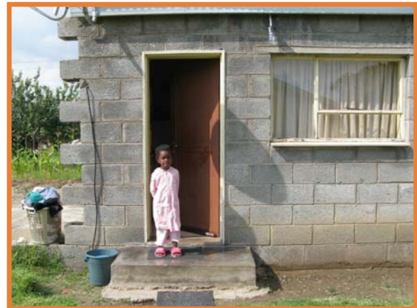
Ein Mädchen in einem städtischen Haushalt in Lesotho.

Auch in afrikanischen Gesellschaften finden sich zahlreiche unterschiedliche Familien-, Verwandtschafts- bzw. Haushaltsformen. Eine vorherrschende oder gar einheitliche Sozialform gab und gibt es nicht . Wie in Europa haben wir es auch in Afrika mit komplexen, sich wandelnden Realitäten verwandtschaftlichen und familiären Lebens zu tun. Wie überall ist das Zusammenleben auch in afrikanischen Gesellschaften von Fürsorge und gegenseitiger Unterstützung geprägt und ebenso von Auseinandersetzungen und Konflikten .